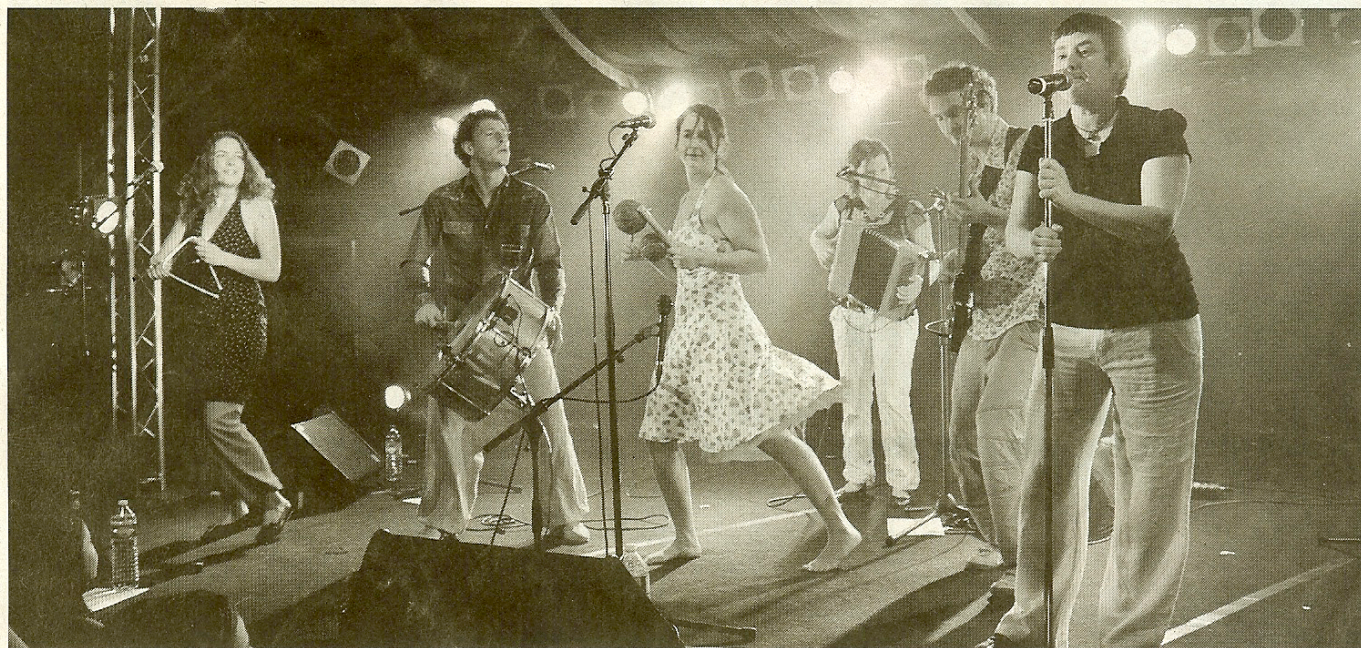
Lors du festival Aubercail, à Aubervilliers (Seine-Saint-Denis), en mai 2008.

Le groupe créé dans le quartier Arnaud-Bernard de Toulouse est au Festival de jazz d'Amiens